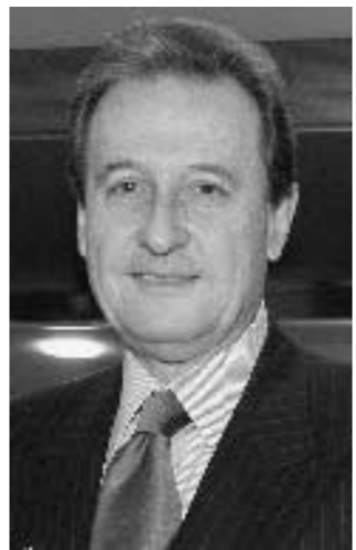
Angelo Provasoli, presidente Oic

le Abi, Enrico Granata — perché l'atteggiamento di apertura su tematiche come il macrohedging è sembrato sfumare da parte del board». E per illustrare le proprie ragioni, l'Abi ha scritto al presidente della Commissione Prodi: «È necessario che l'Ecofin approvi una versione ridotta delle nuove norme di contabilità internazionale, ovvero escludendo gli Ias 32 e 39 che devono assolutamente essere rivisti e comunque non approvati sino a quando il draft dello Iasb non farà chiarezza».